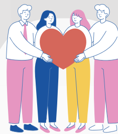
何か社会貢献になることはないか、とお考えの企業様