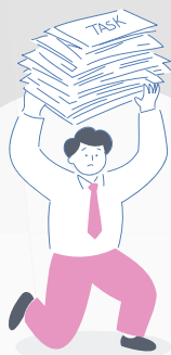
繁忙期のスポットのマンパワーをお探しの企業様

しかし、個人の長所や特技を存分に発揮し分担することで、生産性や技術力を上げることが可能な事業所様が増え、現在は内職だけでなく、清掃や農業、弁当やお菓子の製造、物流の仕分け、PC入力や在庫管理など、仕事の幅も広がり、新しいことに挑戦される事業所様も拡大しております。