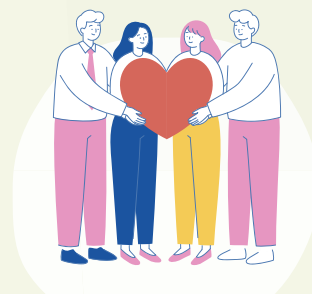
何か社会貢献になることはないか、とお考えの企業様