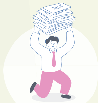
繁忙期のスポットのマンパワーをお探しの企業様

しかし、個人の長所や特技を存分に発揮し分担することで、生産性や技術力を上げることが可能な事業所様が増え、現在は内職だけでなく、清掃や農業、弁当やお菓子の製造、物流の仕分け、PC入力や在庫管理など、仕事の幅も広がり、新しいことに挑戦される事業所様も拡大しております。